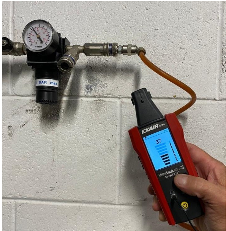
Verifica perdite da raccordi pneumatici

Nei circuiti di distribuzione ad aria compressa, all'interno di capannoni industriali, sono presenti perdite udibili ed altre non udibili dall'uomo (quelle generate da aria che fuoriesce da piccolissimi fori creano ultrasuoni non udibili dall'uomo). Quelle udibili spesso non sono facilmente localizzabili durante il normale orario di lavoro perché il rumore di sottofondo non lo permette. Ultrasonic Leak Detector permette di filtrare il rumore di sottofondo utilizzando i tasti + o - per aumentare o diminuire la sensibilità. Alcuni accessori in dotazione, come la parabola, permettono la rilevazione di perdite rendendo il dispositivo più sensibile alla direzione di provenienza della perdita e meno sensibile al rumore di sottofondo. Oppure, come l'adattatore ed il tubetto flessibile, permettono la rilevazione di perdite in zone difficilmente accessibili come macchinari ed armadi contenenti componenti pneumatici.