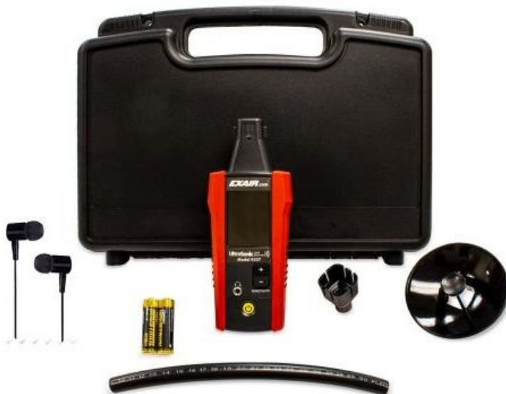
Ultrasonic Leak Detector codice 9207 comprende il rilevatore e tutti gli accessori riportati in figura contenuti in valigetta