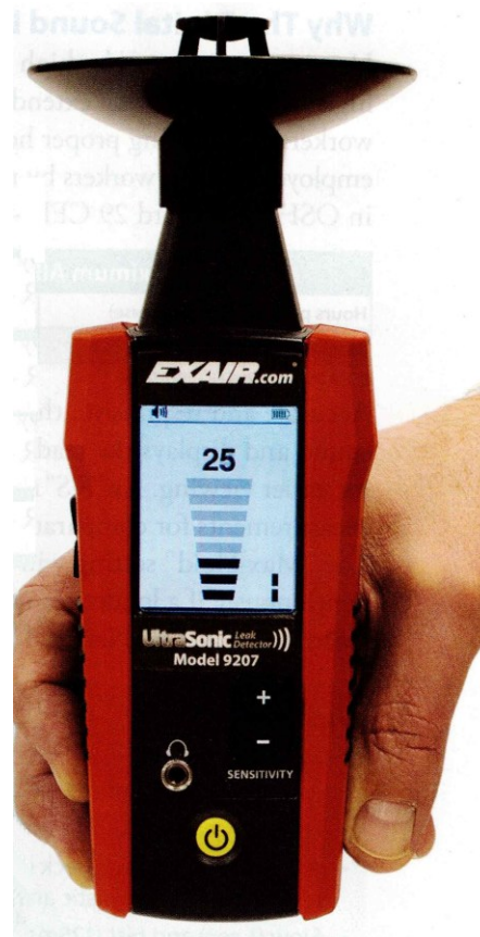
Ultrasonic Leak Detector