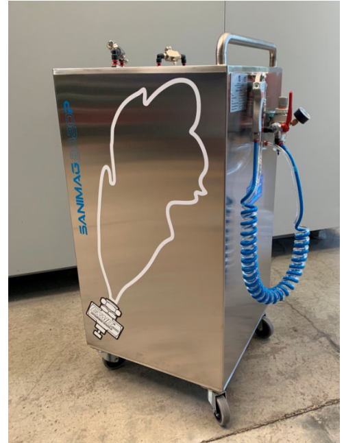
SANIMAG2020P stazione mobile per atomizzare liquidi sanificanti disinfettanti con pistola atomizzatrice per superfici