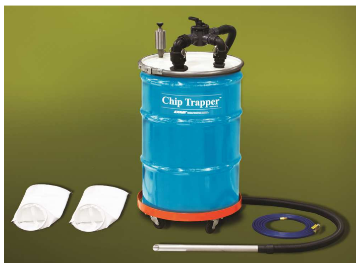
Modello 6198 Chip Trapper pompa reversibile con sistema di separazione solidi-liquidi comprende: 2 filtri a manica riutilizzabili, fusto da 200 litri, carrello porta fusto, 6 metri tubo aria compressa

ATTENZIONE: Questo dispositivo NON deve essere utilizzato per liquidi con basso punto di infiammabilità come benzine o solventi!