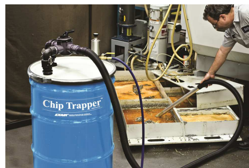
Trucioli ed emulsione nella vasca della macchina