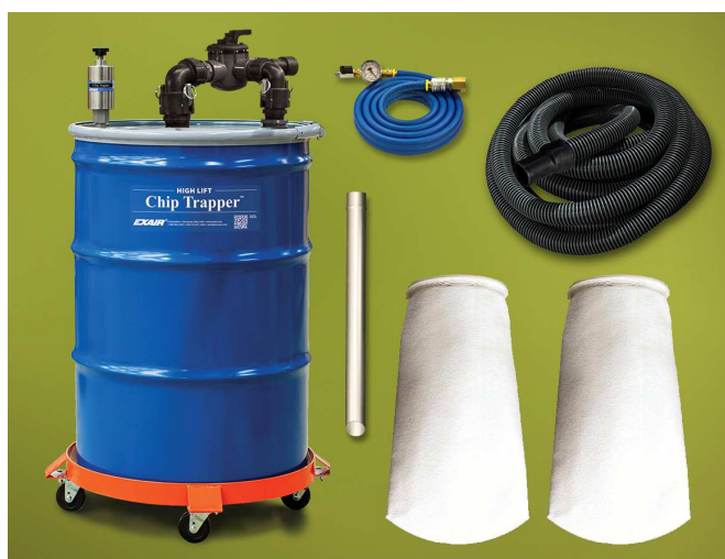
Modello 6190 High Lift Chip Trapper pompa reversibile con sistema di separazione solidi-liquidi comprende: 2 filtri a manica riutilizzabili, fusto da 200 litri, carrello porta fusto, 6 metri tubo aria compressa

ATTENZIONE: Questo dispositivo NON deve essere utilizzato per liquidi con basso punto di infiammabilità come benzine o solventi!