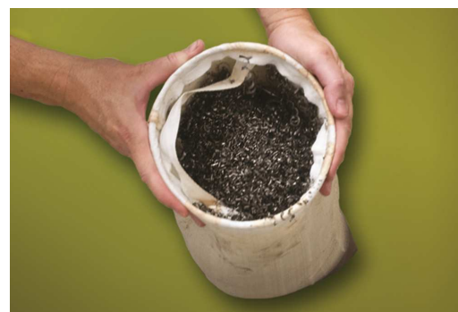
Filtro a manica riutilizzabile