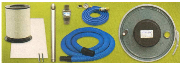
Aspiratore Heavy Duty HEPA Vac System, codice 6199