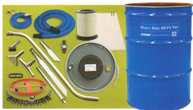
Aspiratore Premium Heavy Duty HEPA Vac codice 6399 (la versione Deluxe Heavy Duty HEPA Vac codice 6299 ha gli stessi accessori escluso il fusto)