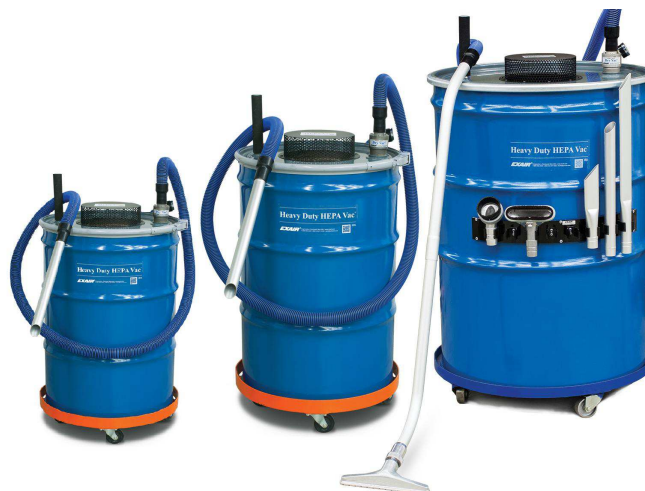
Aspiratore Heavy Duty HEPA Vac disponibile per fusti da 100 200 400 litri

Heavy Duty HEPA Vac trasformano un fusto di metallo in un aspiratore con filtro HEPA funzionante ad aria compressa: aspirano polveri, sporcizia, trucioli, scaglie, trasportandoli direttamente nel fusto. Potente come la versione Heavy Duty Dry Vac, ideale per pulire macchine e zone di lavoro dove la presenza di polveri è elevata.