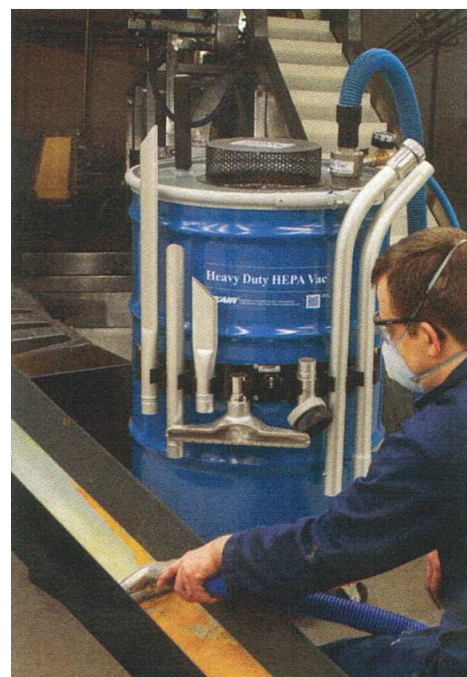
Pulizia di una canalina dalla polvere prodotta dall'impianto

Spesso gli aspiratori elettrici necessitano di sostituzione dei motori ma Heavy Duty HEPA Vac non hanno motori o parti in movimento soggette ad usura perciò la manutenzione non è richiesta. I kit comprendono un nuovo coperchio per i fusti da 200 litri e tutto ciò che serve per trasformare il fusto in aspiratore. Alcuni modelli comprendono anche il fusto in acciaio. Semplici e veloci da mettere in funzione, in qualche minuto sono pronti per l'uso. Sicuri da utilizzare anche con materiali umidi o pavimenti bagnati, non necessitano di elettricità.