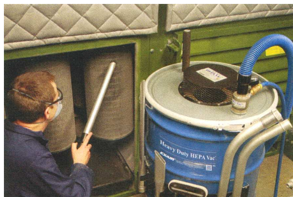
Pulizia di filtri intasati dalla polvere utilizzando l'aspiratore Heavy Duty HEPA Vac