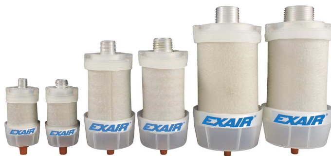
La gamma dei depuratori - silenziatori Exair

Filtrano e recuperano le nebbie oleose presenti nell'aria compressa in uscita da cilindri, valvole e dispositivi pneumatici. Riducono contemporaneamente l'inquinamento acustico.