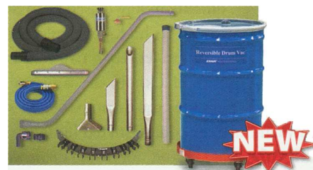
Esempio di Kit Premium Drum Vac