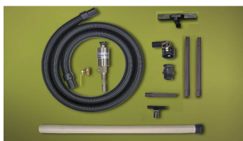
Esempio di Kit Medium Rev. Drum Vac