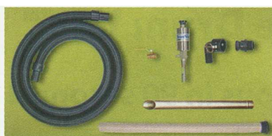
Esempio di Kit Standard Rev. Drum Vac

ATTENZIONE: Questo dispositivo NON deve essere utilizzato per liquidi con basso punto di infiammabilità come benzine o solventi!