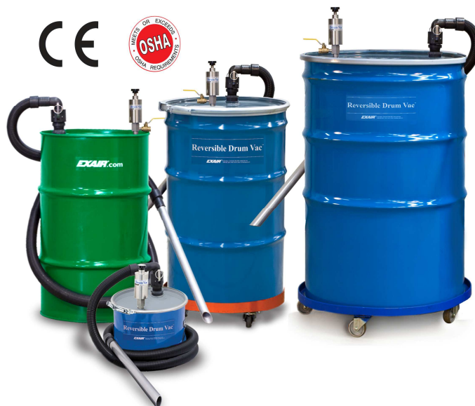
Pompe per fusti Reversible Drum Vac Exair disponibili per fusti da 20 100 200 400 litri