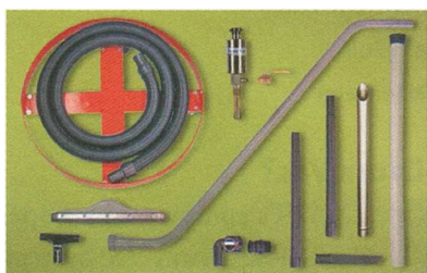
Esempio di Kit Deluxe Drum Vac