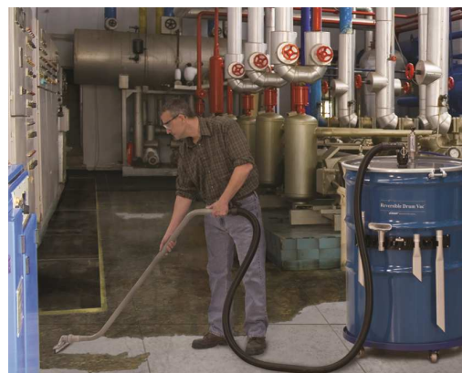
Premium Reversible Drum Vac 6396-110