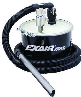
Mini Drum Vac, il fusto da 20 litri è in dotazione