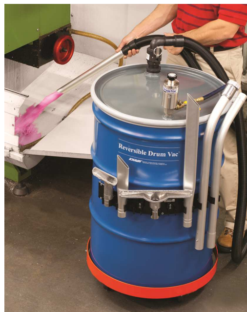
Premium Reversible Drum Vac 6396