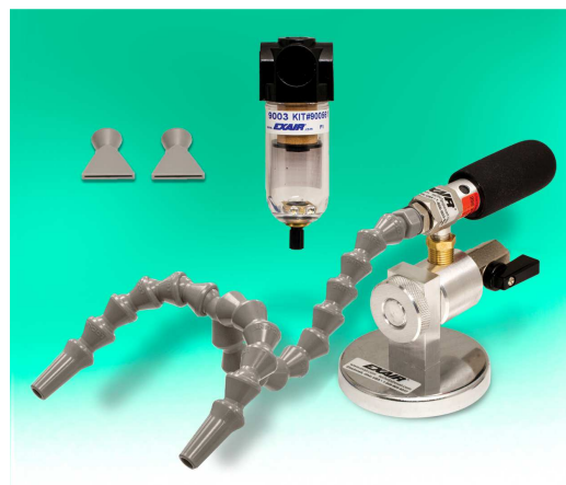
Kit Mini Cooler 3304 composto da raffreddatore, tubetto snodabile a due uscite, base magnetica e filtro