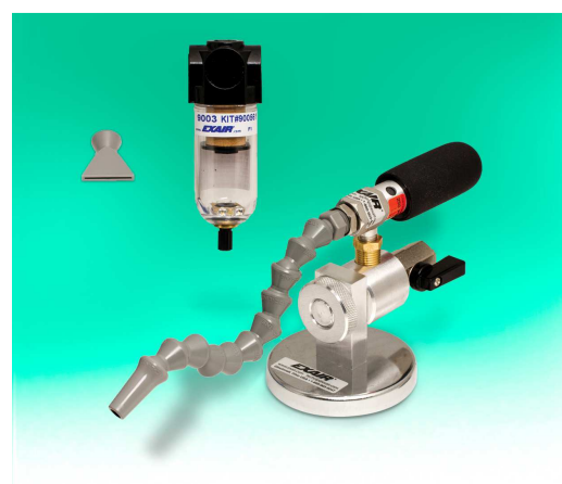
Kit Mini Cooler 3808 dotato di tubetto snodabile ad una uscita base magnetica orientabile e filtro