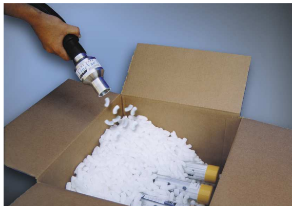
Light Duty Line Vac codice 130150 trasporta materiale per imballo