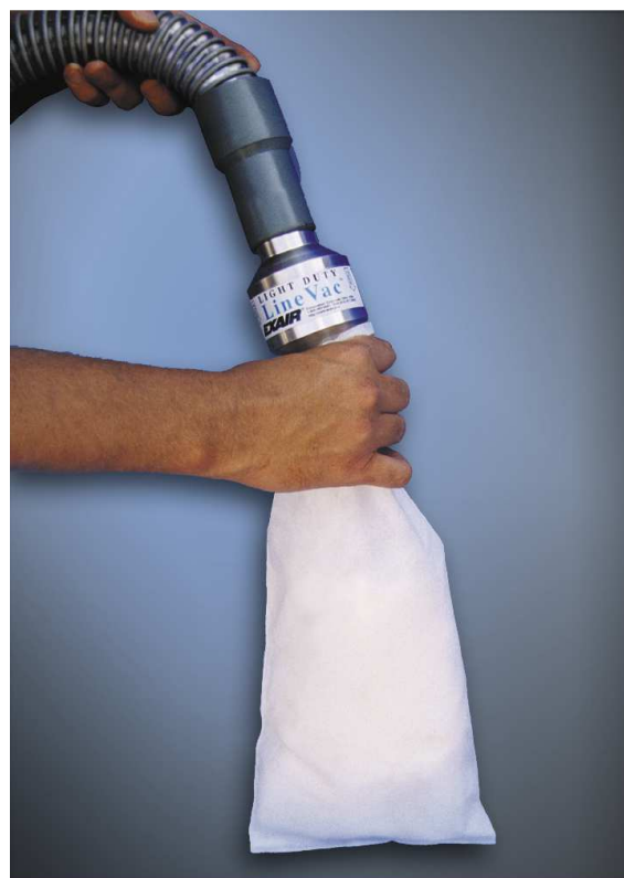
Light Duty Line Vac codice 130150 riempie un sacco di materiale