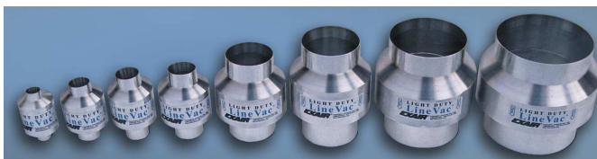
La gamma dei Light Duty Line Vac

Gli aspiratori in linea sono ideali per movimentare rapidamente materiale su distanze fino a 10 – 15 metri. L'aria compressa è iniettata nei dispositivi producendo una forte depressione da un lato ed una spinta dall'altro. Il materiale viene istantaneamente aspirato e spinto nella condotta di trasporto: la portata è regolabile semplicemente agendo sulla pressione aria compressa. Essendo azionati unicamente con aria compressa sono dispositivi sicuri e non hanno necessità di manutenzione periodica.