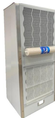
CLEAN FAN CCS sistema di filtrazione aria installato su un condizionatore