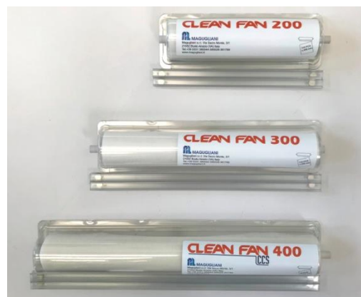
CLEAN FAN e CLEAN FAN CCS sistema di filtrazione aria per ventole di armadi elettrici, condizionatori, compressori, scambiatori