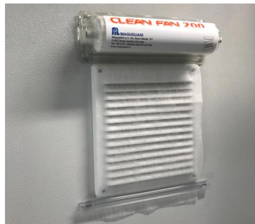
CLEAN FAN installato su ventola di un armadio elettrico