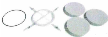
CLEAN FAN MOTOR sistema di filtrazione di ventole di motori