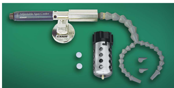
Kit raffreddatore regolabile codice 3925 con tubetto snodabile a due uscite e filtro