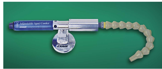
Raffreddatore Regolabile con base magnetica e tubetto snodato 5901