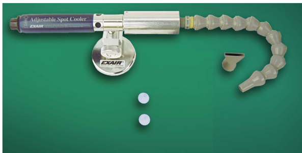
Kit raffreddatore regolabile codice 3825J con tubetto snodabile ad una uscita

Sono disponibili kit che comprendono, oltre al raffreddatore regolabile, la base magnetica orientabile, il tubetto snodabile ad una oppure due uscite con ugelli cilindrici ed a ventaglio, due generatori per modificare la capacità di raffreddamento ed eventualmente anche il filtro separatore di condensa.