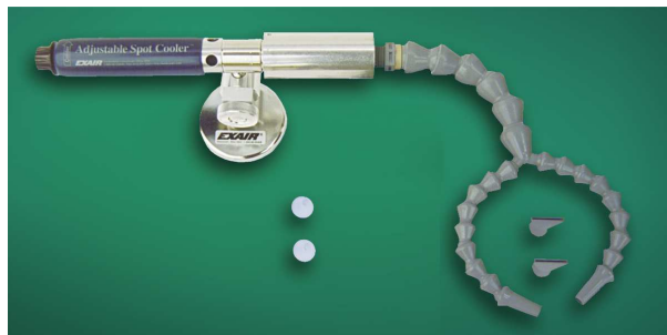
Kit raffreddatore regolabile codice 3925J con tubetto snodabile a due uscite