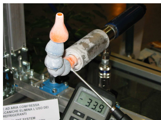
Raffreddatore Exair durante un test per verificare la temperatura in uscita