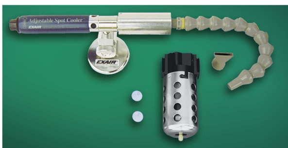
Kit raffreddatore regolabile codice 3825 con tubetto snodabile ad una uscita e filtro