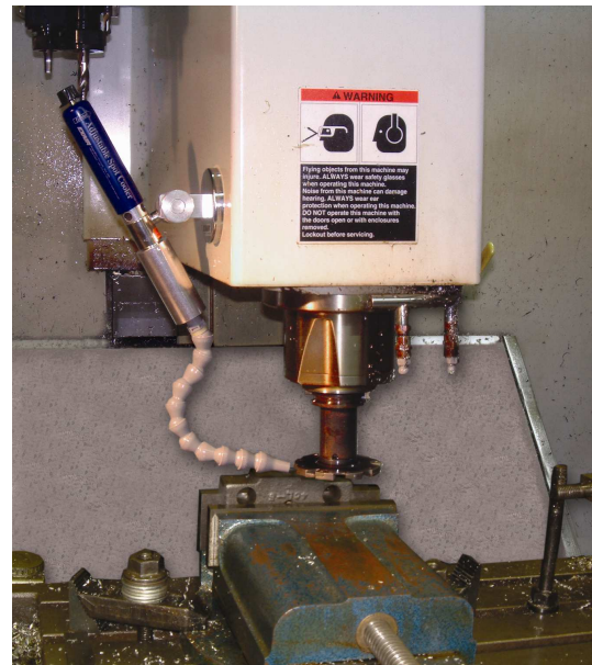
Raffreddamento in fresatura