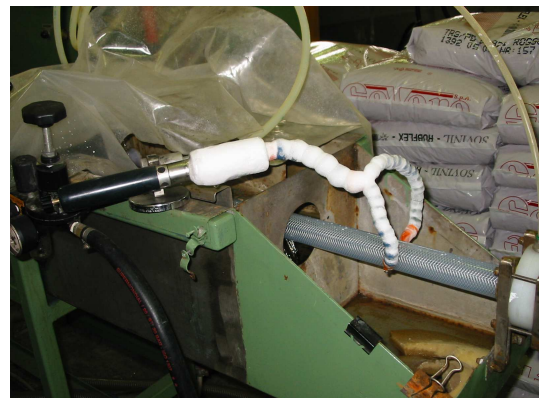
Raffreddamento di tubi dopo l'estrusione