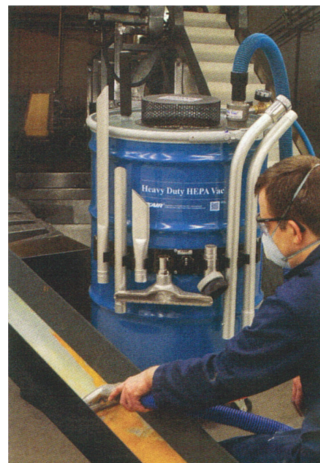
Pulizia di una canalina dalla polvere prodotta dall'impianto

Spesso gli aspiratori elettrici necessitano di sostituzione dei motori ma Heavy Duty HEPA Vac non hanno motori o parti in movimento soggette ad usura perciò la manutenzione non è richiesta. I kit comprendono un nuovo coperchio per i fusti da 200 litri e tutto ciò che serve per trasformare il fusto in aspiratore. Alcuni modelli comprendono anche il fusto in acciaio. Semplici e veloci da mettere in funzione, in qualche minuto sono pronti per l'uso. Sicuri da utilizzare anche con materiali umidi o pavimenti bagnati, non necessitano di elettricità.