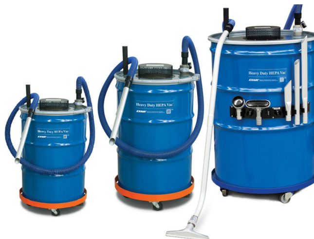
Aspiratore Heavy Duty HEPA Vac disponibile per fusti da 100 200 400 litri

Heavy Duty HEPA Vac trasformano un fusto di metallo in un aspiratore con filtro HEPA funzionante ad aria compressa: aspirano polveri, sporcizia, trucioli, scaglie, trasportandoli direttamente nel fusto. Potente come la versione Heavy Duty Dry Vac, ideale per pulire macchine e zone di lavoro dove la presenza di polveri è elevata.