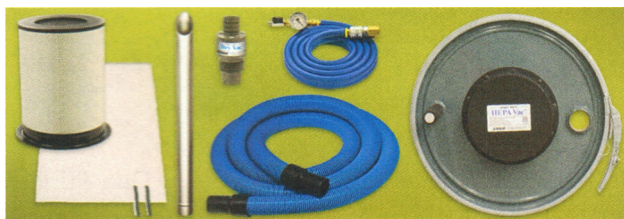
Aspiratore Heavy Duty HEPA Vac System, codice 6199