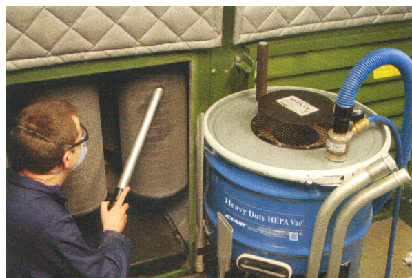
Pulizia di filtri intasati dalla polvere utilizzando l'aspiratore Heavy Duty HEPA Vac