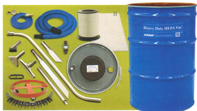
Aspiratore Premium Heavy Duty HEPA Vac codice 6399 (la versione Deluxe Heavy Duty HEPA Vac codice 6299 ha gli stessi accessori escluso il fusto)