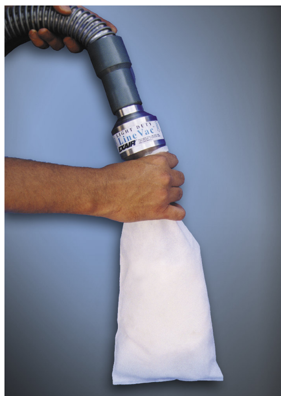
Light Duty Line Vac codice 130150 riempie un sacco di materiale