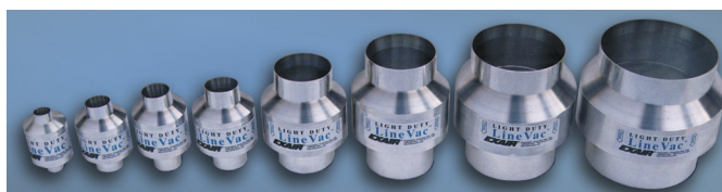
La gamma dei Light Duty Line Vac

Gli aspiratori in linea sono ideali per movimentare rapidamente materiale su distanze fino a 10 – 15 metri. L'aria compressa è iniettata nei dispositivi producendo una forte depressione da un lato ed una spinta dall'altro. Il materiale viene istantaneamente aspirato e spinto nella condotta di trasporto: la portata è regolabile semplicemente agendo sulla pressione aria compressa. Essendo azionati unicamente con aria compressa sono dispositivi sicuri e non hanno necessità di manutenzione periodica.