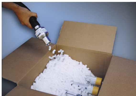
Light Duty Line Vac codice 130150 trasporta materiale per imballo