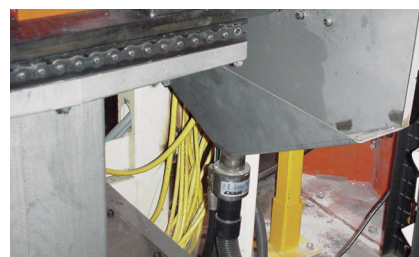
Heavy Duty Line Vac 150125 aspira prodotti dal fondo di una tramoggia