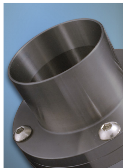
Gli Heavy Duty Line Vac sono costruiti in acciaio temprato