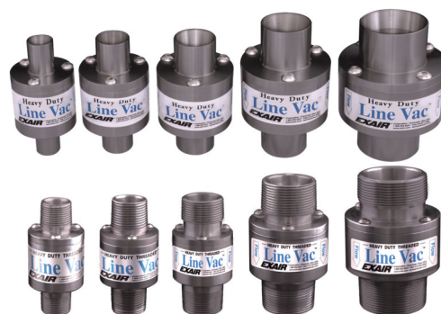
La gamma degli Heavy Duty Line Vac comprende anche modelli filettati