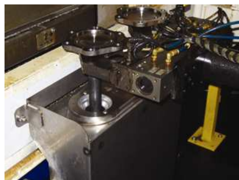
Semi-asse passa attraverso Standard Air Wipe per rimuovere residui di lavorazione