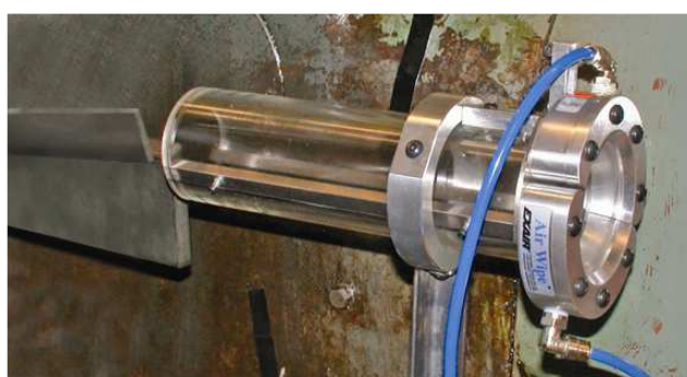
Standard Air Wipe pulisce dal liquido e residui di lavorazione pezzi che passano attraverso il dispositivo