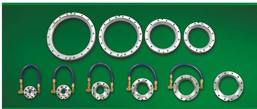
La gamma Standard Air Wipe con passaggio da diametro 10 mm fino a 279 mm

I fori sul lato posteriore del dispositivo sono predisposti per l'installazione con l'utilizzo di viti da 1/4 UNC. L'ingresso dell'aria compressa fino al modello con passaggio 4" (102 mm) è uno solo (da G 1/4); per i modelli con passaggio da 5" (127 mm) fino a 7" (178 mm) sono due (da G 1/4) mentre per i modelli da 9" (229 mm) e da 11" (279 mm) gli ingressi sono due per lato (sempre da G 1/4). La regolazione delle prestazioni è semplice: si agisce sulla pressione dell'aria compressa oppure sostituendo i rasamenti installati (in dotazione da 0,05 mm) con altri di diverso spessore inclusi nella serie oppure aggiungendone altri.