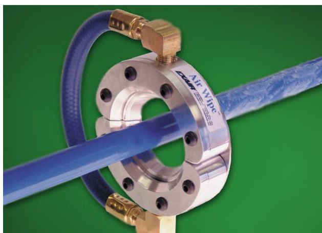
Standard Air Wipe codice 2432