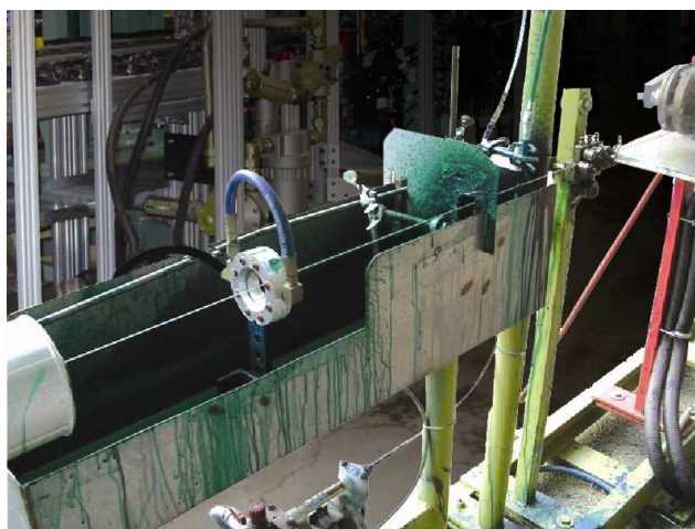
Standard Air Wipe 2431 elimina il rivestimento in eccesso dal cavo in produzione