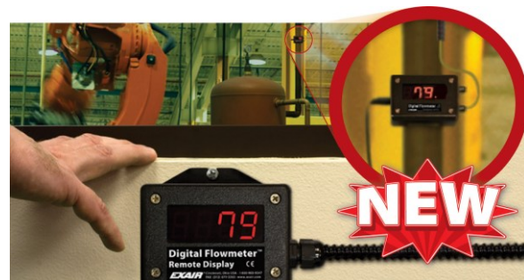
Display remote per Digital Flow Meter