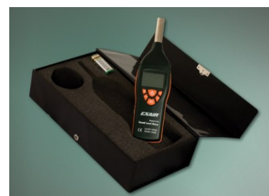
Ogni Digital Sound Level Meter è fornito in valigetta antiurto