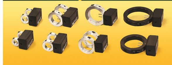
DIGITAL Flow Meter con USB Data Logger