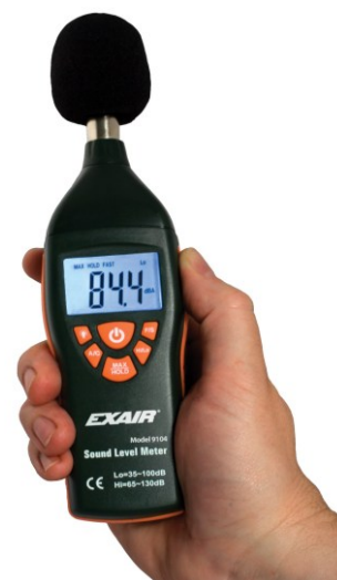
Digital Flow Level Meter

L'esposizione per ore ad elevati livelli di inquinamento acustico possono indurre gravi problemi all'orecchio umano ai lavoratori che non sono dotati di DPI. Digital Sound Level Meter (con certificazione NIST, CE, ANSI, IEC Type 2 SLM) in dotazione al Responsabile della Sicurezza permette il monitoraggio dell'ambiente per evitare di superare i limiti di legge.