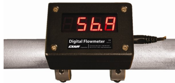
Misuratore di flusso Digital Flow Meter

Utilizzabile con aria compressa ed azoto