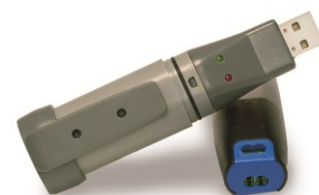
Chiavetta USB Data Logger