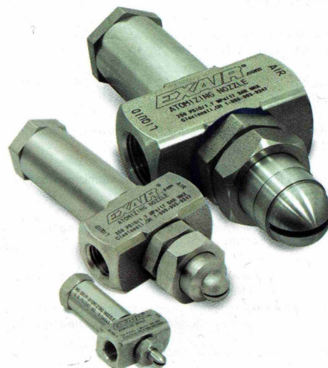
Ugelli atomizzatori Exair con sistema antigoccia alimentazione a sifone