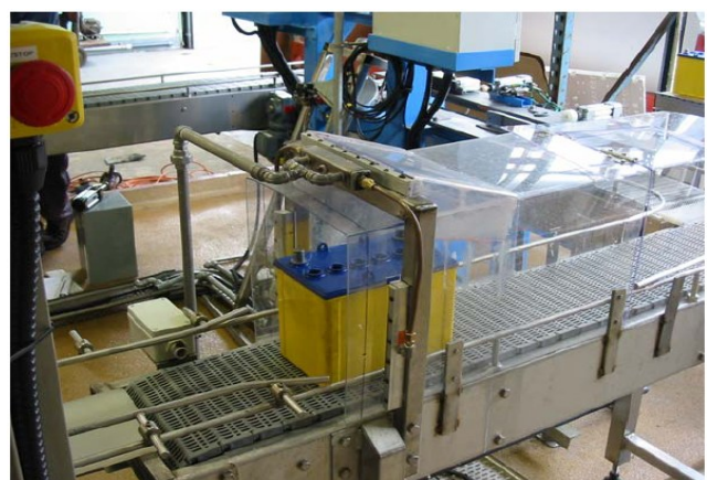
Asciugatura di batterie per autotrazione dopo riempimento con acido