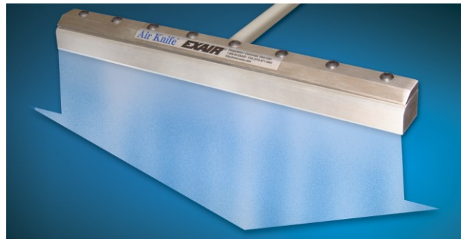
Full Flow Air Knife codice 2612

Impiegati per soffiare, pulire, asciugare, raffreddare o separare due ambienti con una tenda d'aria invisibile. La versione Full Flow è caratterizzata da dimensioni contenute e rapporto di amplificazione di 30:1; sfruttando l'effetto "coanda", il dispositivo muove 30 parti di aria ambiente per 1 parte di aria compressa consumata.