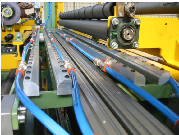
Full Flow Air Knife portano il film plastico nella corretta direzione