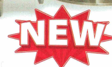
Sanitary Flanged Line Vac