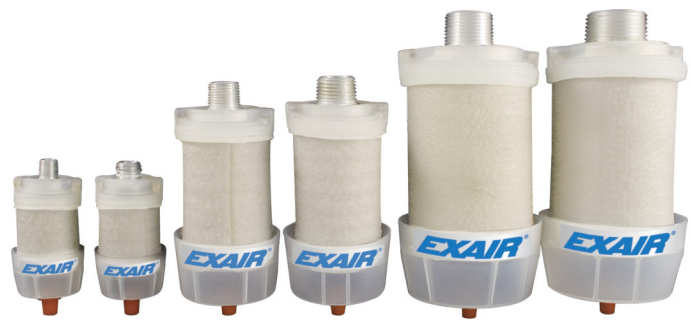
La gamma dei depuratori - silenziatori Exair

Filtrano e recuperano le nebbie oleose presenti nell'aria compressa in uscita da cilindri, valvole e dispositivi pneumatici. Riducono contemporaneamente l'inquinamento acustico.