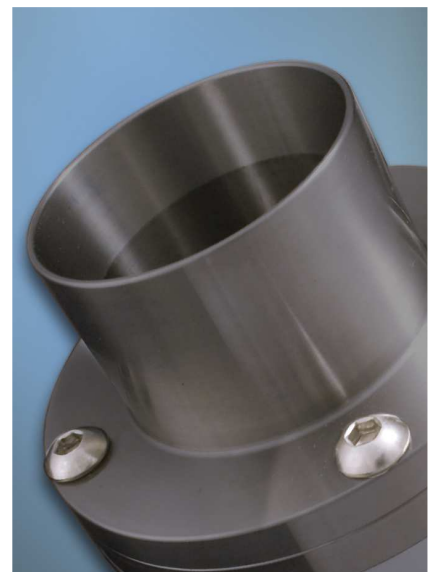
Gli Heavy Duty Line Vac sono costruiti in acciaio temprato