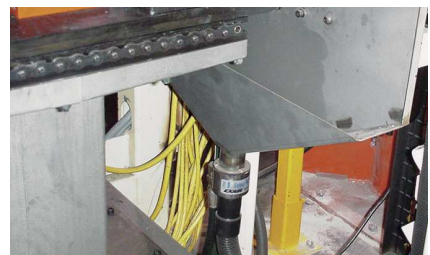
Heavy Duty Line Vac 150125 aspira prodotti dal fondo di una tramoggia