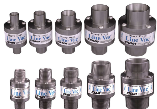
La gamma degli Heavy Duty Line Vac comprende anche modelli filettati