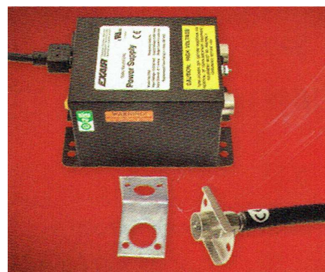
Kit Gen4 Ionizing Point codice 8299

Cavo di lunghezza speciale disponibile come optional