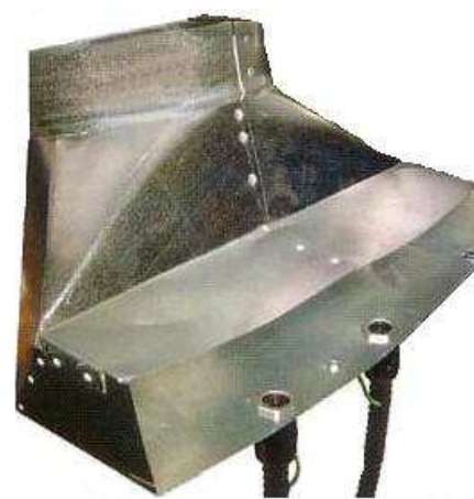
Due Gen4 Ionizing Point installati su condotta per ventilazione