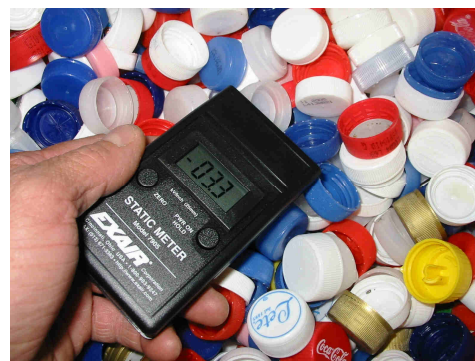
Rilevazione di cariche elettrostatiche su contenitore di tappi PET