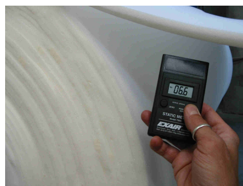
Rilevazione di cariche elettrostatiche su poliuretano espanso flessibile