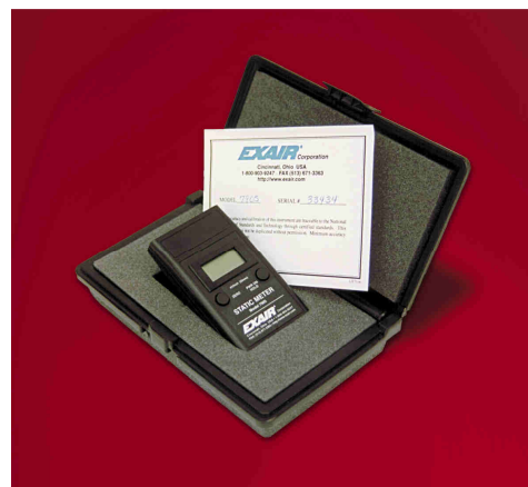
Static Meter 7905

Il misuratore di cariche elettrostatiche Static Meter Exair è conforme alla direttiva 2002/95/EC RoHS incluso L 214/65