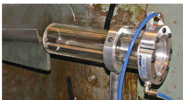
Standard Air Wipe pulisce dal liquido e residui di lavorazione pezzi che passano attraverso il dispositivo