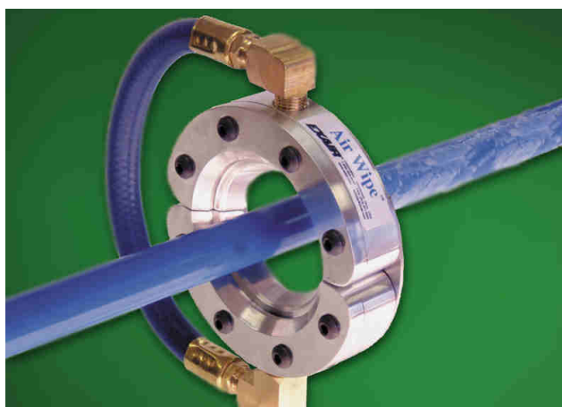
Standard Air Wipe codice 2432