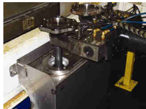
Semiassa passa attraverso Standard Air Wipe per rimuovere residui di lavorazione