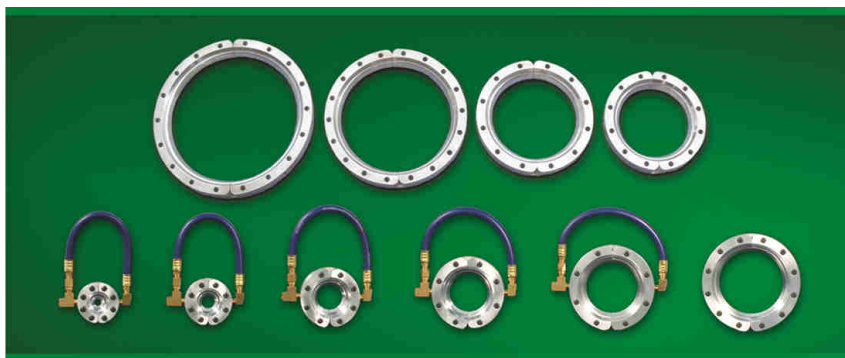
La gamma Standard Air Wipe con passaggio da diametro 13 mm fino a 279 mm

I fori sul lato posteriore del dispositivo sono predisposti per l'installazione con l'utilizzo di viti da 1/4 UNC. L'ingresso dell'aria compressa fino al modello con passaggio 4" (102 mm) è uno solo (da G 1/4); per i modelli con passaggio da 5" (127 mm) fino a 7" (178 mm) sono due (da G 1/4) mentre per i modelli da 9" (229 mm) e da 11" (279 mm) gli ingressi sono due per lato (sempre da G 1/4). La regolazione delle prestazioni è semplice: si agisce sulla pressione dell'aria compressa oppure sostituendo i rasamenti installati (in dotazione da 0,05 mm) con altri di diverso spessore inclusi nella serie oppure aggiungendone altri.