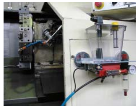
AIR LUBROCOLD installato su tornio CNC