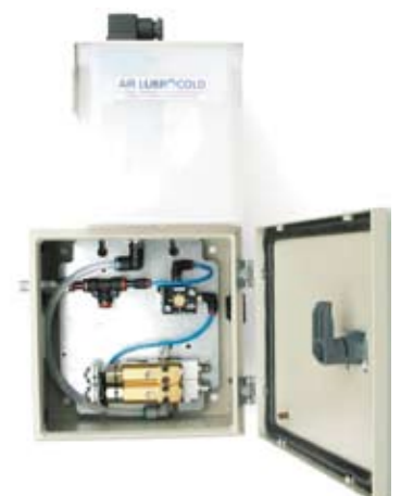
Centralina in scatola metallica con serbatoio 2,2 litri, due mini pompe