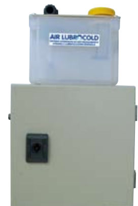
Centralina in scatola metallica con serbatoio 1,2 litri, una mini pompa