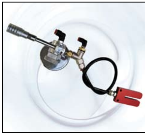
Ugello aria fredda –olio versione a forcella per segatrici - troncatrici