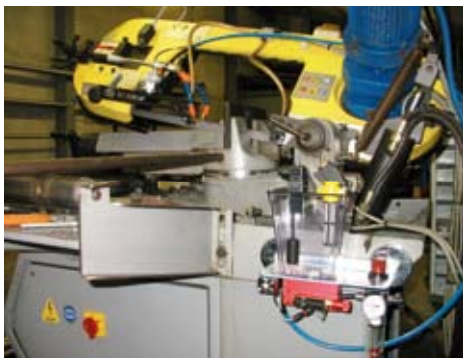
AIR LUBROCOLD a due uscite installato su segatrice