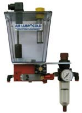
Centralina con serbatoio un litro, una mini pompa