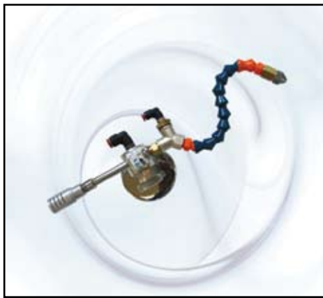
Singolo ugello aria fredda –olio con base magnetica