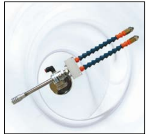
Doppio ugello aria fredda –olio con base magnetica