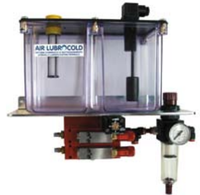
Centralina con serbatoio tre litri, due mini pompe