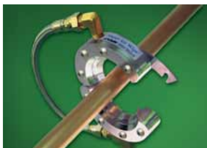
Super Air Wipe è apribile per facilitare l'installazione anche su estrusori in lavorazione