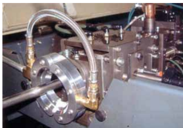
Super Air Wipe evita fuoriuscita di olio da taglio durante la lavorazione