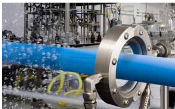
Super Air Wipe in acciaio inox rimuove l'acqua da un tubo estruso dopo la vasca di raffreddamento