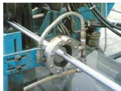
Super Air Wipe asciuga un tubo dopo la laminazione