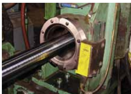
Super Air Wipe 2404 pulisce un cilindro d'acciaio durante la lavorazione

I fori sul lato posteriore del dispositivo sono predisposti per l'installazione con l'utilizzo di viti da 1/4 UNC. L'ingresso dell'aria compressa fino al modello con passaggio 4" (102 mm) è uno solo (da G 1/4); per i modelli con passaggio da 5" (127 mm) fino a 7" (178 mm) sono due (da G 1/4), mentre per i modelli da 9" (229 mm) e da 11" (279 mm) gli ingressi sono due per lato (sempre da G 1/4). La regolazione delle prestazioni avviene tramite la diversa pressione dell'aria compressa oppure aggiungendo altri rasamenti dello stesso spessore oltre a quello in dotazione da 0,05 mm.