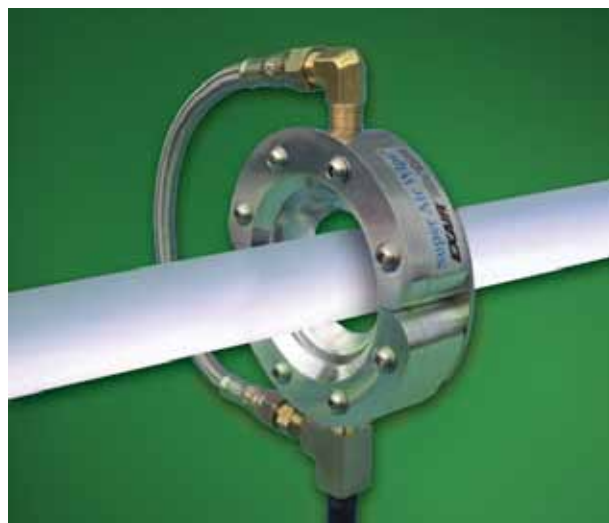
Il disegno compatto e apribile permette una facile installazione