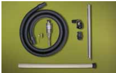
Kit Standard Drum Vac 6196 per fusti da 200 litri dotato di lancia in alluminio per aspirazione da vasche

ATTENZIONE: Questo dispositivo NON deve essere utilizzato per liquidi con basso punto di infiammabilità come benzine o solventi!