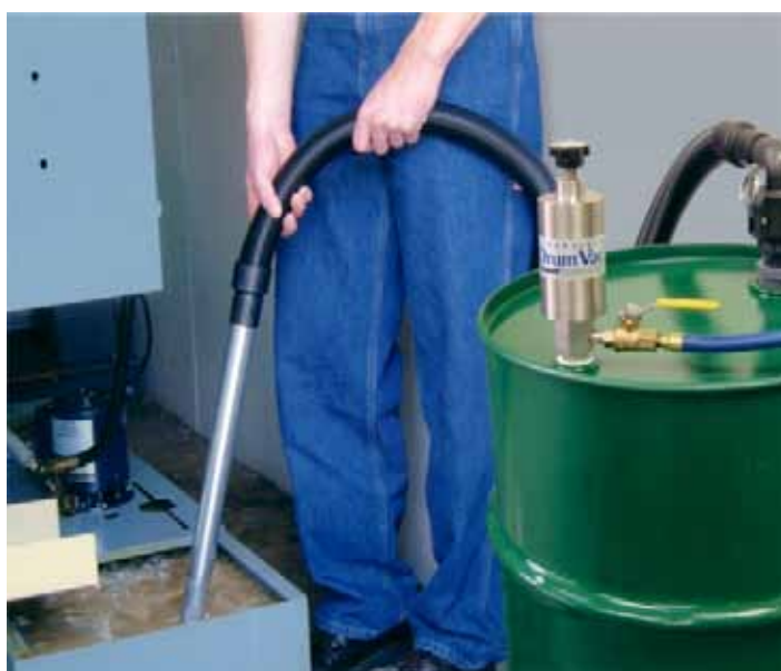
Reversible Drum Vac 6196