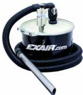
Mini Drum Vac fornita con fusto da 20 litri