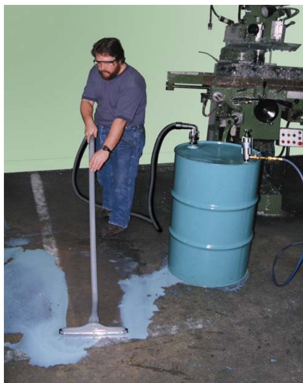
Reversible Drum Vac 6196 con kit aspirazione liquidi da pavimenti 6901