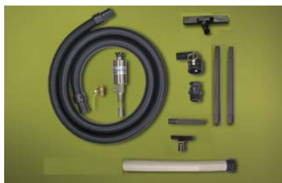
Kit Medium Drum Vac 6191-16 per fusti da 60 litri dotato di accessori per aspirazione da vasche e pavimenti