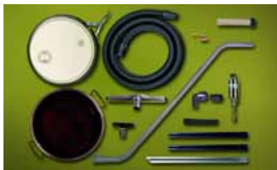
Kit Mini Drum Vac 6196-5 per fusti da 20 litri dotato di accessori per aspirazione con fusto a coperchio amovibile