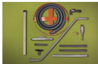
Kit Deluxe Drum Vac 6296 per fusti da 200 litri dotato di accessori per aspirazione da vasche e pavimenti e carrello per fusto