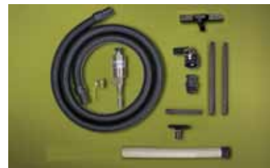
Kit Medium Drum Vac 6191-16 per fusti da 60 litri dotato di accessori per aspirazione da vasche e pavimenti