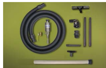
Kit Medium Drum Vac 6191-30 per fusti da 100 litri dotato di accessori per aspirazione da vasche e pavimenti