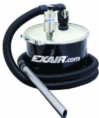
Mini Drum Vac fornita con fusto da 20 litri