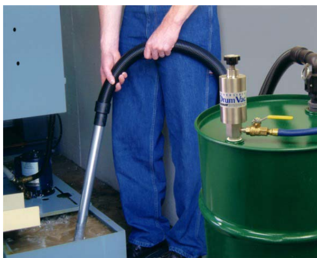
Reversible Drum Vac 6196