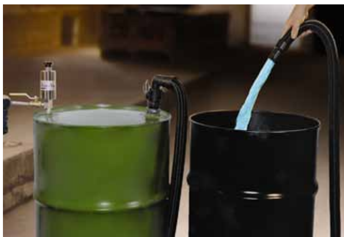
Reversible Drum Vac Standard 6196