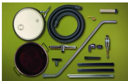
Kit Mini Drum Vac 6196-5 per fusti da 20 litri dotato di accessori per aspirazione da vasche e pavimenti, con fusto a coperchio amovibile