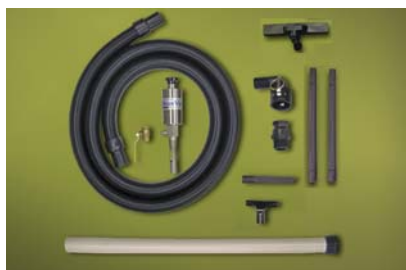
Kit Medium Drum Vac 6191 per fusti da 200 litri dotato di accessori per aspirazione da vasche e pavimenti