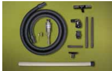
Kit Medium Drum Vac 6191 per fusti da 200 litri dotato di accessori per aspirazione da vasche e pavimenti