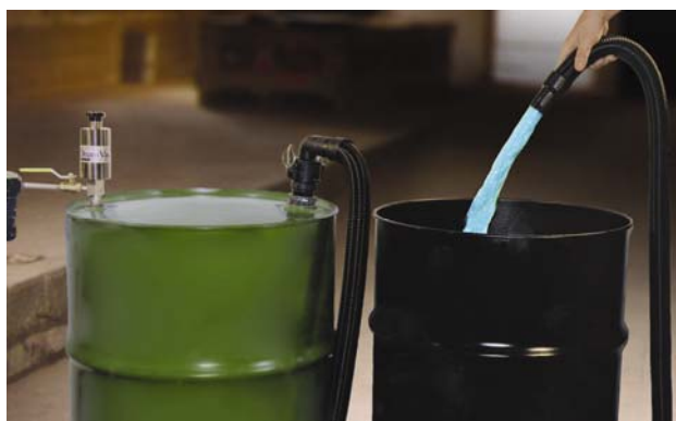
Reversible Drum Vac Standard 6196

Costruite in acciaio inox, funzionano solo ad aria compressa, trovano il loro principale impiego per il veloce travaso di liquidi da fusti e vasche e viceversa.