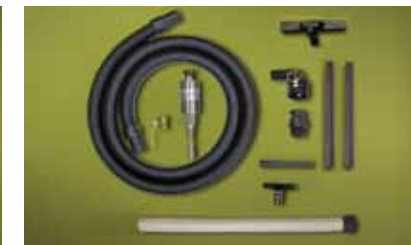
Kit Medium Drum Vac 6191-30 per fusti da 100 litri dotato di accessori per aspirazione da vasche e pavimenti