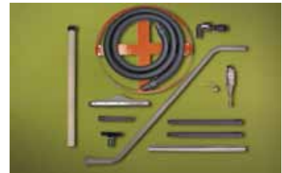
Kit Deluxe Drum Vac 6296 per fusti da 200 litri dotato di accessori per aspirazione da vasche, pavimenti, carrello fusto