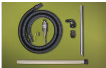
Kit Standard Drum Vac 6196 per fusti da 200 litri dotato di lancia in alluminio per aspirazione da vasche

ATTENZIONE: Questo dispositivo NON deve essere utilizzato per liquidi con basso punto di infiammabilità come benzine o solventi