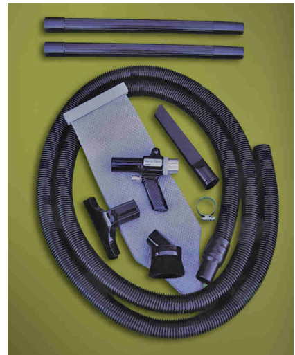
Kit Vac-U-Gun All Purpose System codice 6392 con sacco filtro, tubo flessibile ed accessori