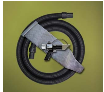
Kit Deep Hole Vac-U-Gun codice 6394 con sacco filtro e tubo flessibile