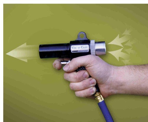
Pistola Vac-U-Gun 6092 regolata su soffiaggio