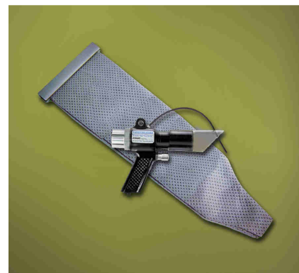
Kit Deep Hole Vac-U-Gun codice 6194 con sacco filtro