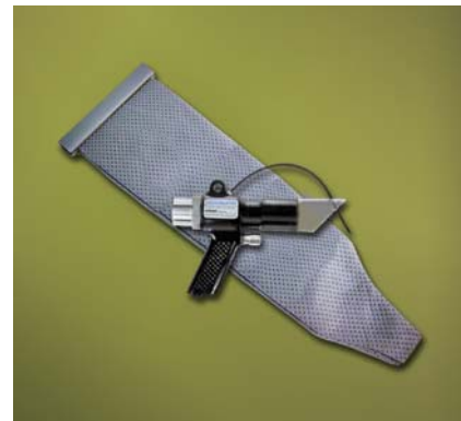
Kit Deep Hole Vac-U-Gun codice 6194 con sacco filtro