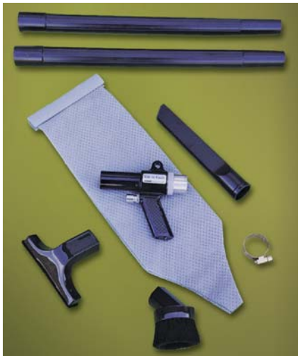
Kit Vac-U-Gun Collection System codice 6192 con sacco filtro ed accessori