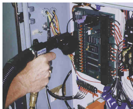
Vac-U-Gun con spazzola per aspirare polvere