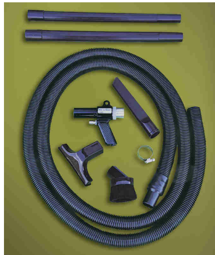
Kit Vac-U-Gun Transfer System codice 6292 con tubo flessibile ed accessori