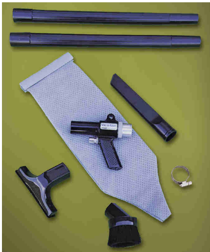
Kit Vac-U-Gun Collection System codice 6192 con sacco filtro ed accessori