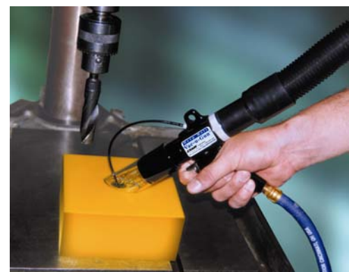
Deep Hole Vac-U-Gun 6094 soffia nel foro e aspira i residui di lavorazione