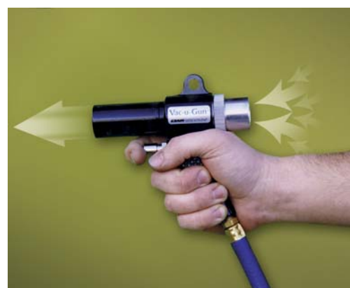
Pistola Vac-U-Gun 6092 regolata su soffiaggio