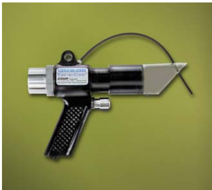
Pistola Deep Hole Vac-U-Gun codice 6094