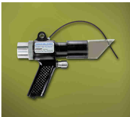
Pistola Deep Hole Vac-U-Gun codice 6094