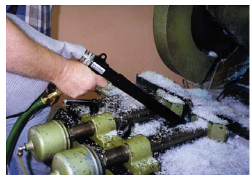
Kit Collection System 6192 aspira polvere di plastica