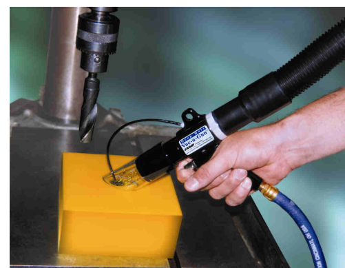
Deep Hole Vac-U-Gun 6094 soffia nel foro e aspira i residui di lavorazione