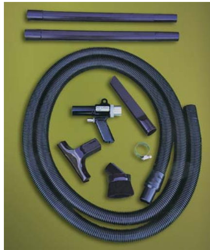
Kit Vac-U-Gun Transfer System codice 6292 con tubo flessibile ed accessori