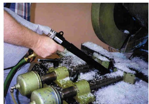
Kit Collection System 6192 aspira polvere di plastica