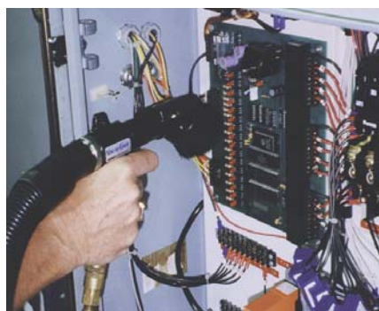
Vac-U-Gun con spazzola per aspirare polvere