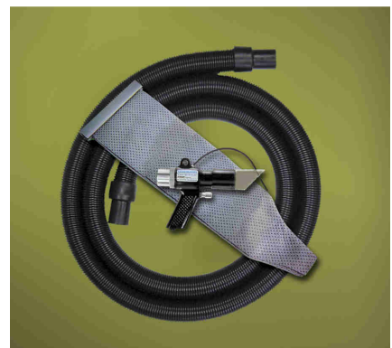
Kit Deep Hole Vac-U-Gun codice 6394 con sacco filtro e tubo flessibile