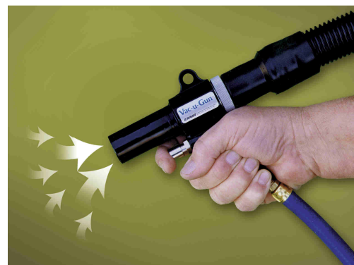
Pistola Vac-U-Gun 6092 regolata su aspirazione

La soluzione ai problemi di pulizia delle macchine industriali è Vac-u-Gun: unione di una pistola per soffiare ed un aspiratore che è in grado di raccogliere sporcizia all'interno del sacco filtro oppure di convogliarla per mezzo di un tubo flessibile all'interno di un contenitore.