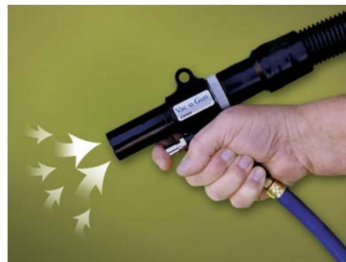
Pistola Vac-U-Gun 6092 regolata su aspirazione

Deep Hole Vac-u-Gun sono state progettate per la pulizia di fori ciechi da trucioli, liquidi e residui di lavorazione, costruite in alluminio perciò leggere e di lunga durata, disponibili singolarmente oppure in 2 diversi kit abbinati a vari accessori. Le pistole Deep Hole Vac-U-Gun sono in grado di soffiare all'interno del foro da pulire per mezzo del tubetto flessibile e contemporaneamente aspirare sporcizia all'interno del sacco filtro oppure convogliarla per mezzo di un tubo flessibile all'interno del contenitore di raccolta.