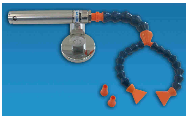
Raffreddatore Eco Cold Gun 5310J (doppia uscita)