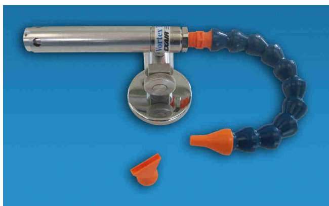
Raffreddatore Eco Cold Gun 5210J (singola uscita)