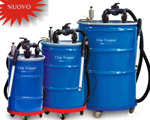
Sistema High Lift Chip Trapper codice 6190-30 (fusto da 100 litri) 6190 (fusto da 200 litri) 6190-110 (fusto da 400 litri)