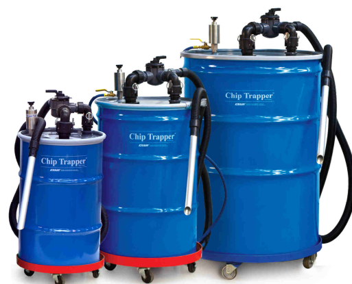
Sistema Chip Trapper codice 6198-30 (fusto da 100 litri) 6198 (fusto da 200 litri) 6198-110 (fusto da 400 litri)