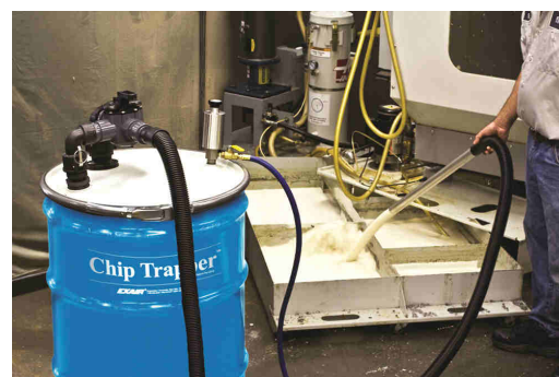
Emulsione filtrata da Chip Trapper