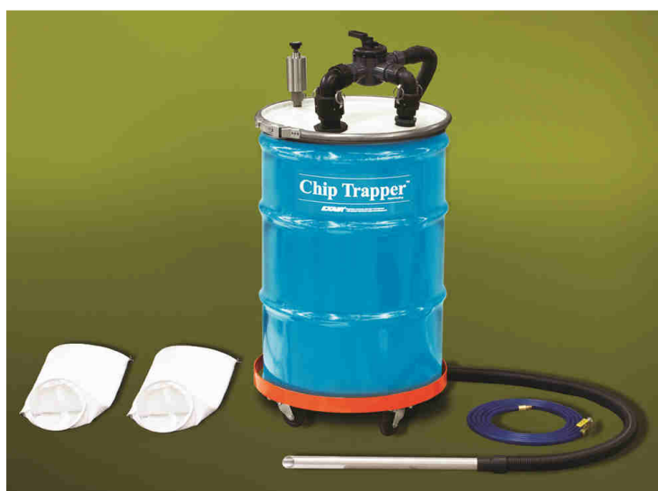
Modello 6198 Chip Trapper pompa reversibile con sistema di separazione solidi-liquidi comprende: 2 filtri a manica riutilizzabili, fusto da 200 litri, carrello porta fusto, 6 metri tubo aria compressa

ATTENZIONE: Questo dispositivo NON deve essere utilizzato per liquidi con basso punto di infiammabilità come benzine o solventi!