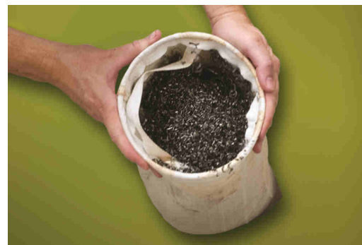
Filtro a manica riutilizzabile