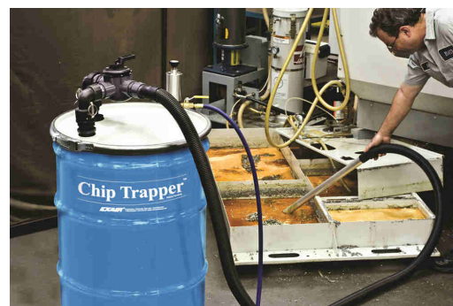
Trucioli ed emulsione nella vasca della macchina