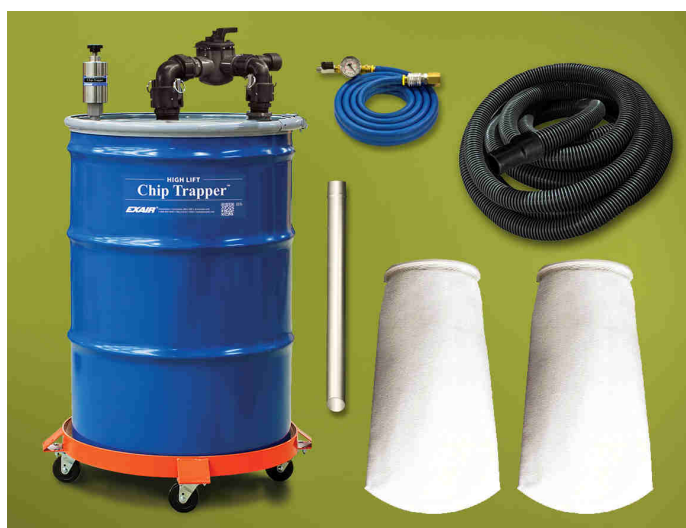
Modello 6190 High Lift Chip Trapper pompa reversibile con sistema di separazione solidi-liquidi comprende: 2 filtri a manica riutilizzabili, fusto da 200 litri, carrello porta fusto, 6 metri tubo aria compressa

ATTENZIONE: Questo dispositivo NON deve essere utilizzato per liquidi con basso punto di infiammabilità come benzine o solventi!